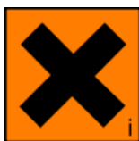
Xi - Irritante